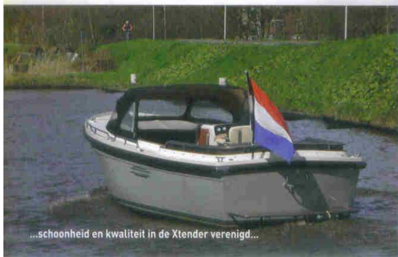
...schoonheid en kwaliteit in de Xtender verenigd...

De kleur is lichtgrijs, deze kleur neemt bijna als een kameleon de tint van de omgeving enigszins aan. Als één der oudste hybride-systeembouwers (al meer dan 12 jaar ervaring) heeft Damarin zelfs het gekende Mastervolt systeem nog terdege aangepast. Damarin wilde verder een sportieve uitstraling, een maximale doorvaarhoogte van 1.30 mtr. Er moest op een redelijke manier kunnen worden overnacht en ook mee op vakantie gaan. Een slim toegankelijk toilet annex douche met dubbele klep blijkt zelfs geschikt voor langere mensen. De boot is geschikt voor 8/9 personen en voor gebruik op zee goedgekeurd. Ook jongere mensen hebben grote belangstelling voor de Grand Coast. Alle goede dingen uit andere vaardisciplines lijken in dit hybride-schip verenigd; de gedegen ontwerpperiode van 16 maanden levert een slimme XTender op, op de toekomst voorbereid!