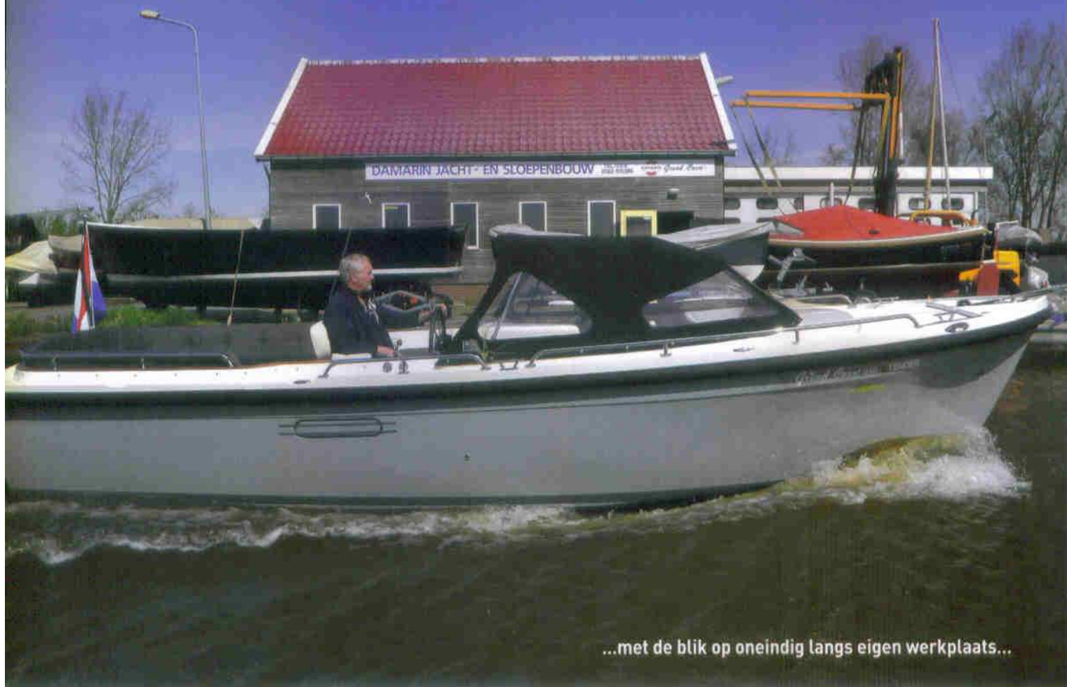
...met de blik op oneindig langs eigen werkplaats...