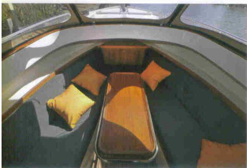
...de ruimte in het vooronder...