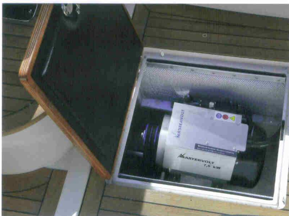
...de gekoppelde en aangepaste Mastervolt elektromotor...