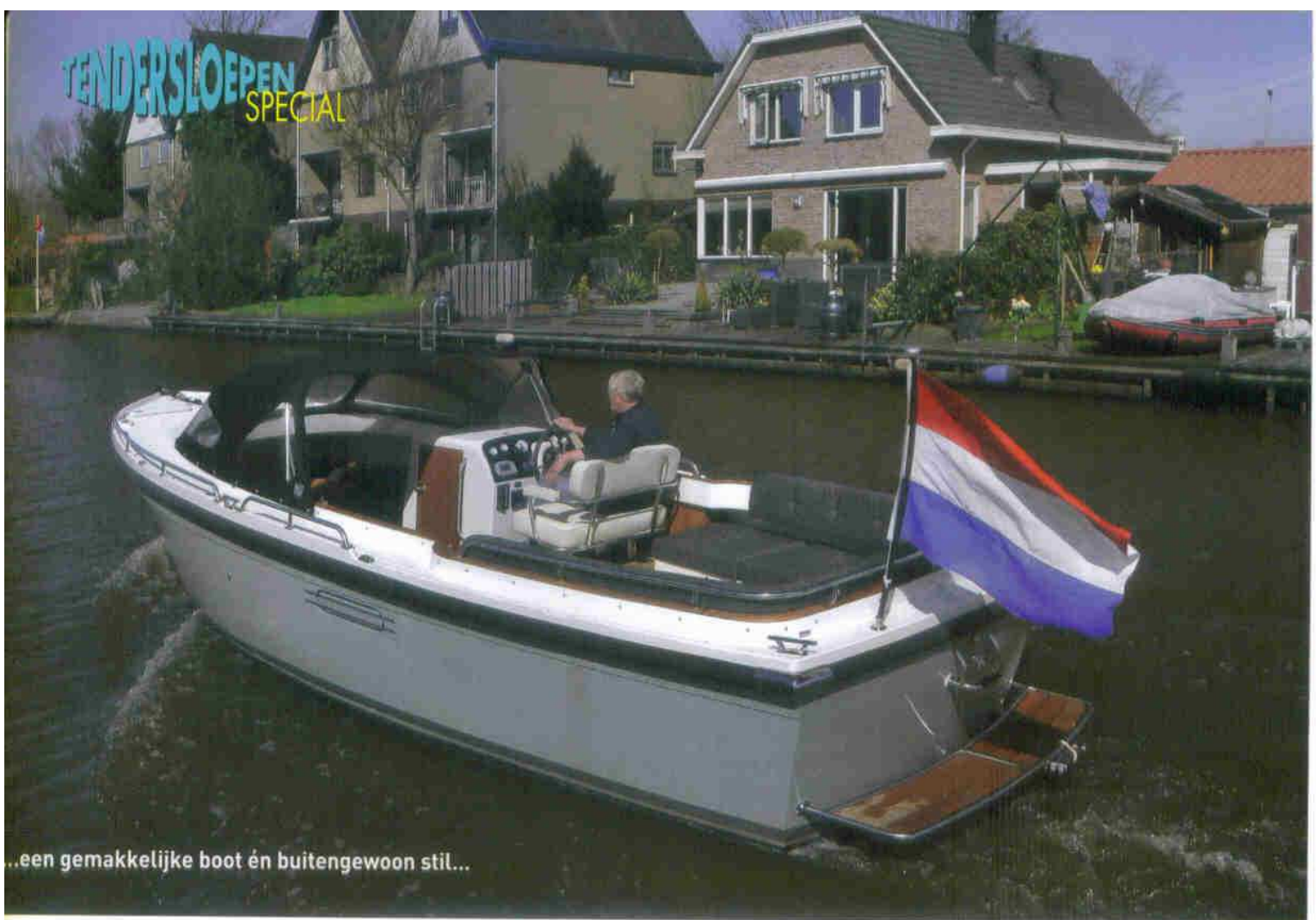
...een gemakkelijke boot én buitengewoon stil...