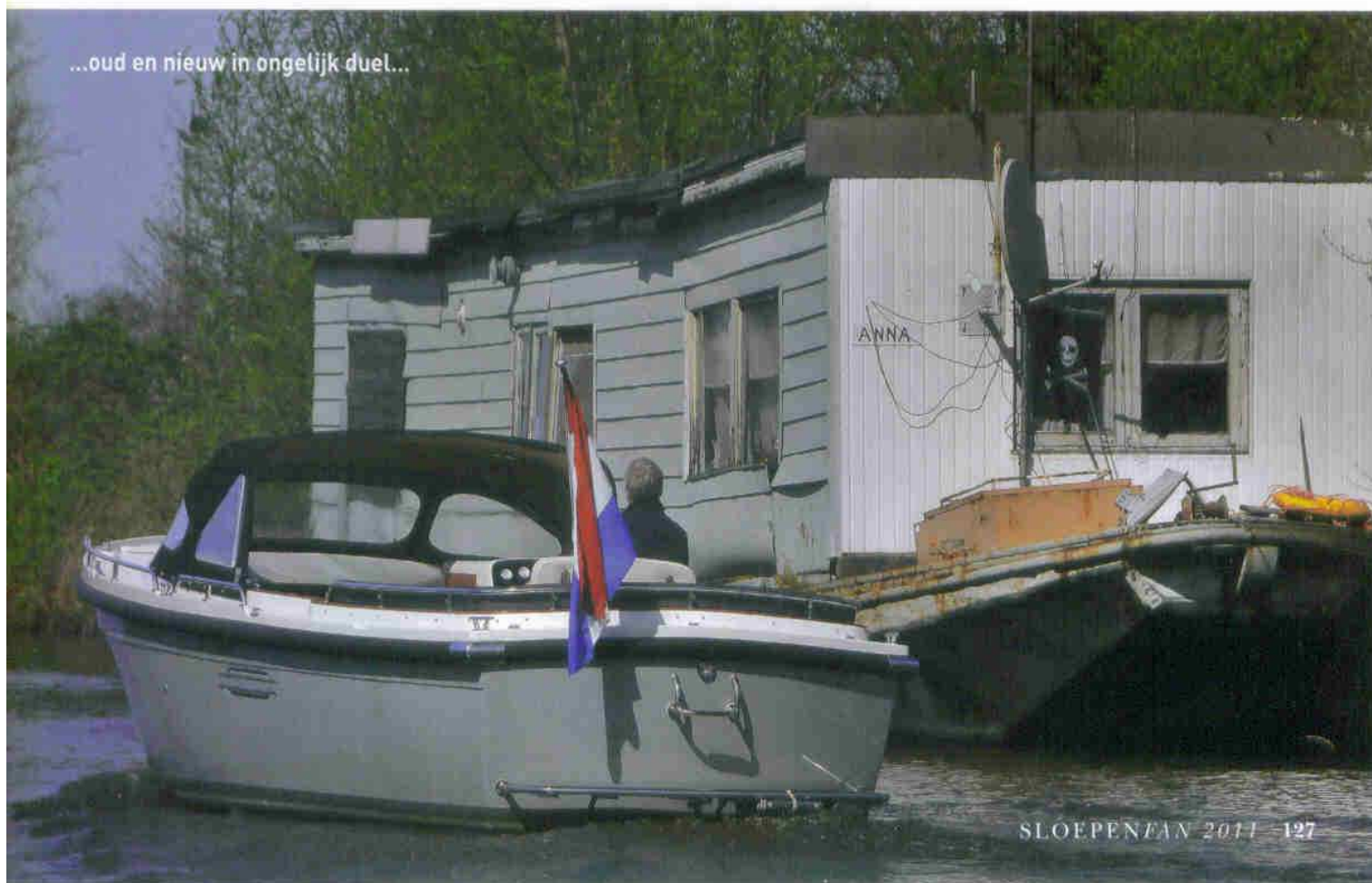
...oud en nieuw in ongelijk duel...