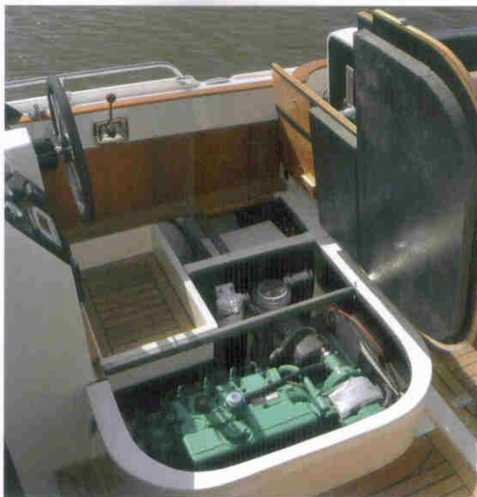
...bank klapt in één beweging weg voor de dieselmotor...