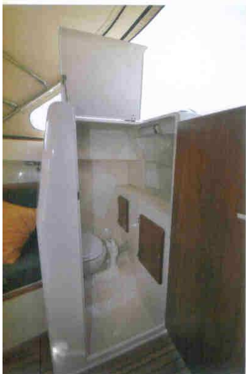
...slim toilet/douche, ook voor lange mensen...