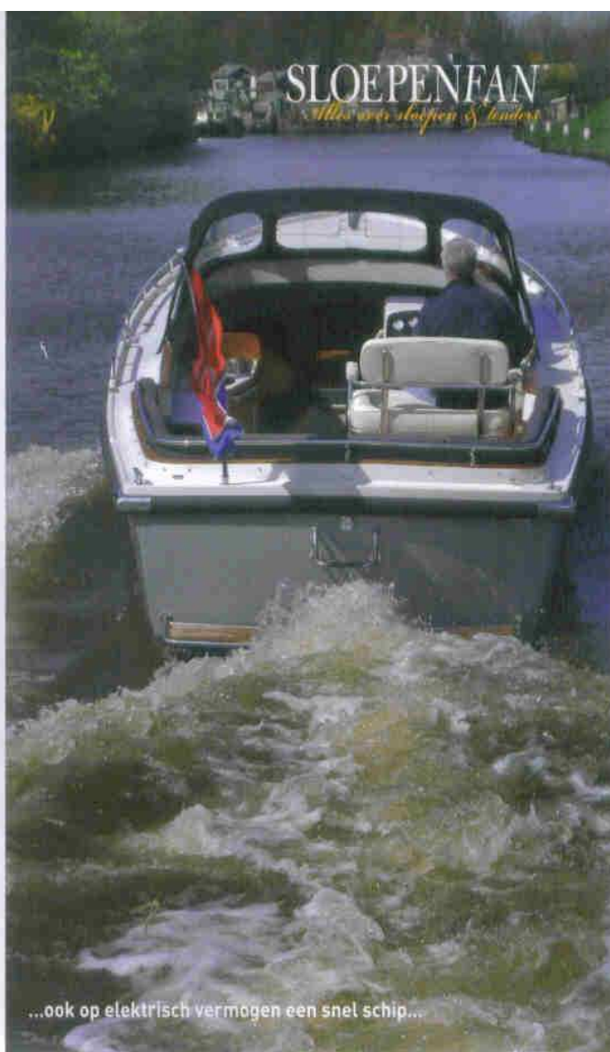
...ook op elektrisch vermogen een snel schip...