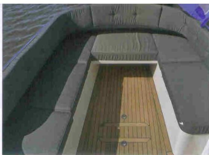
...ruime, loungeachtige zithoek...