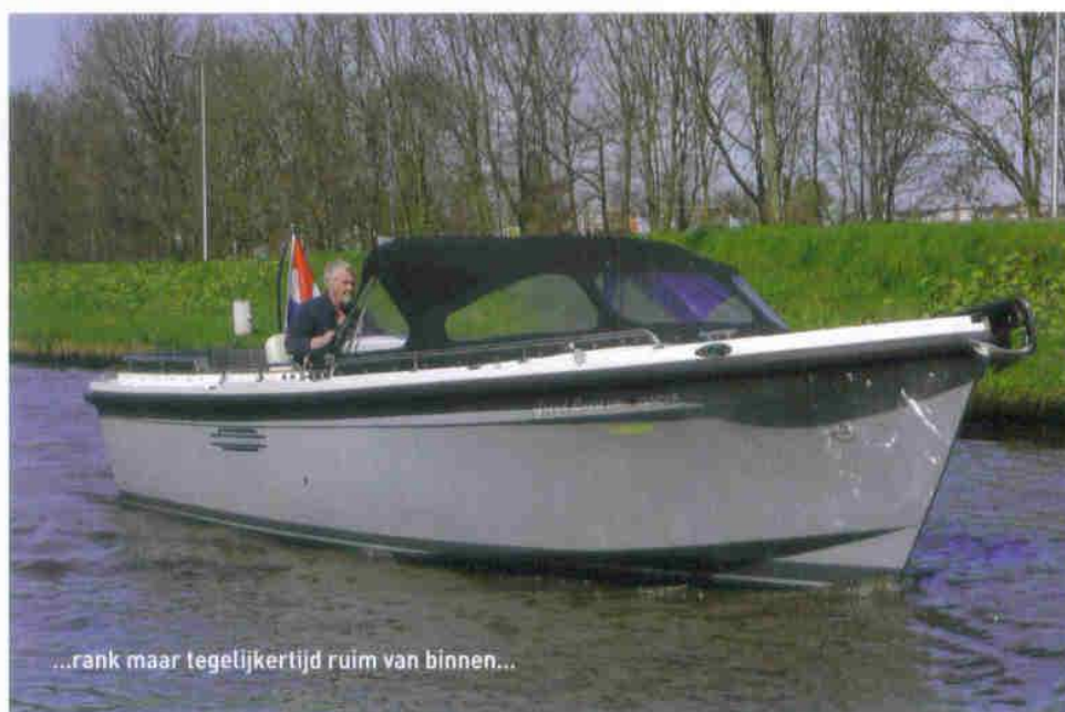
...rank maar tegelijkertijd ruim van binnen...

De motoren werken niet tegelijkertijd, wel is een snelle, beveiligde overgang mogelijk. Het geheel der dingen heeft